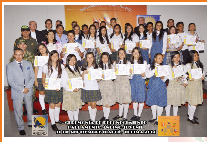
CELEBRACIÓN DE RECONOCIMIENTO PARLAMENTO ANDINO JUVENIL 10 DE SEPTIEMBRE I BAGUÉ, TOLIMA 2014

También quisiera hacer un reconocimiento especial a la ciudad de Ibagué por acogernos nuevamente y felicitarla tras 10 años de haber sido Declarada por el Parlamento Andino como la Capital Andina de los Derechos Humanos y la Paz, por su condición de centro de convivencia y desarrollo de los más altos valores éticos de los ciudadanos andinos, por ser un espacio propicio de encuentro para la paz y por el trabajo abnegado de sus pobladores en pro de la defensa de los derechos humanos.