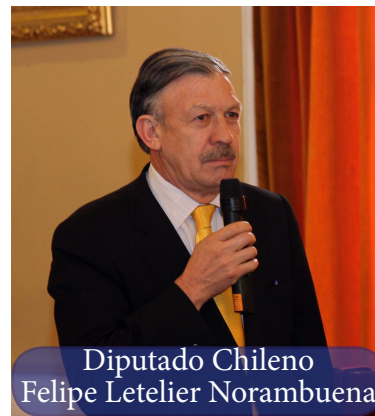
Diputado Chileno Felipe Letelier Norambuena

El Parlamento Andino buscará un trabajo coordinado con los Poderes Legislativos de los países miembros, para garantizar el acceso universal a la educación de los ciudadanos andinos.