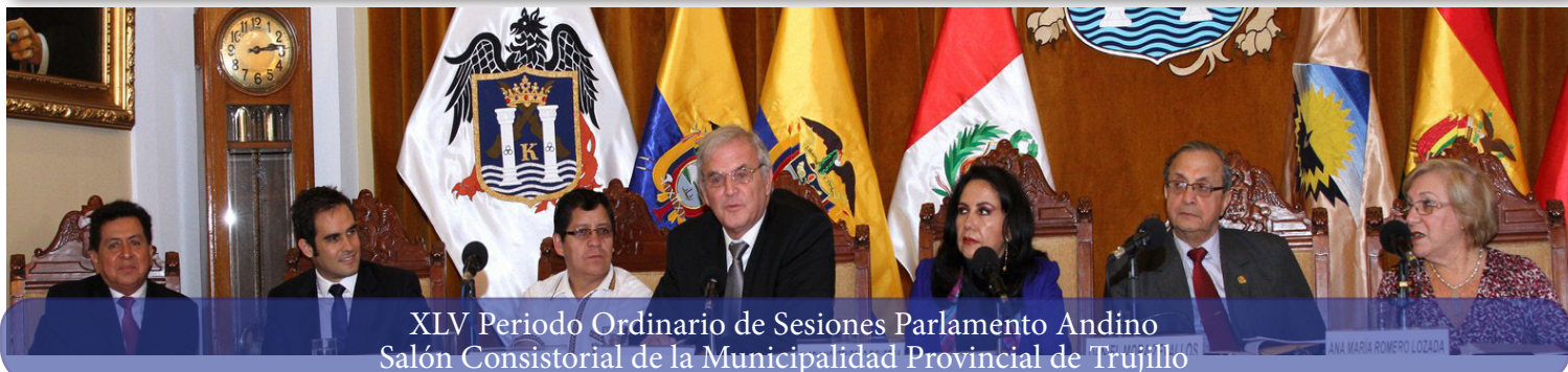
XLV Periodo Ordinario de Sesiones Parlamento Andino Salón Consistorial de la Municipalidad Provincial de Trujillo

L a Mesa Directiva del Parlamento Andino aprobó el pasado 28 de agosto, mediante la Resolución No. 15, respaldar el Proyecto de Ley en curso en el Congreso de Perú, que establece incentivos para la mancomunidad municipal con enfoque territorial en las cuencas hídricas; adicionalmente, recomendó a los demás países de la Comunidad Andina -CAN, discutir este tipo de iniciativas que tienden a proteger los recursos naturales y promover la asociatividad.