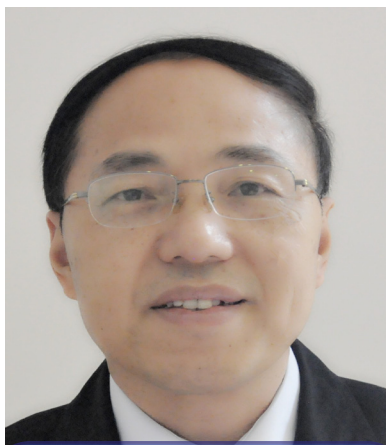
El Embajador de la República Popular de China en Ecuador, Wang Shixion

En las últimas décadas, se han incrementado significativamente las relaciones entre China y América Latina. Este acelerado acercamiento entre los dos continentes, separados por el inmenso Océano Pacífico, no sólo se ha registrado en las áreas política y económico-comercial, sino también en la cultural e intercambio de personas, impulsando el desarrollo de un modelo de amistad y cooperación integral de alto nivel.