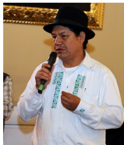
Parlamentario Andino Pedro de la Cruz