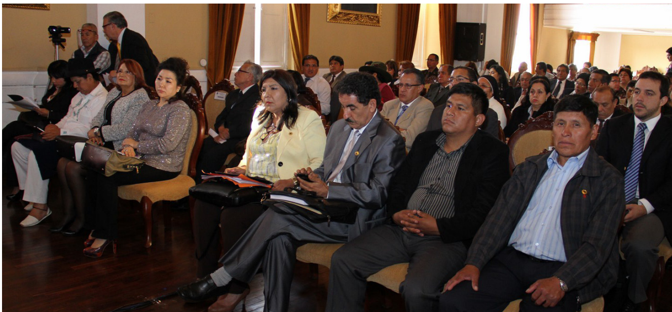
Los Honorables Parlamentarios Andinos de Bolivia, Ecuador, Perú y Chile (como miembro asociado) durante los paneles realizados en el marco del XLV Periodo de Sesiones del organismo.

Cabe destacar que el Parlamento Andino viene realizando esfuerzos para estimular a los Estados y Gobiernos en la realización de políticas públicas sobre Seguridad Ciudadana en la Región, con la aprobación de la Decisión 1257 Sobre el desarrollo de una política pública de Seguridad Ciudadana y Convivencia en la Comunidad Andina (abril 2012), complementada con la Recomendación 213 de agosto de 2012, donde la CAN solicitó a los gobiernos nacionales la adopción de lineamientos estratégicos de convivencia, seguridad y participación ciudadana conjunta.