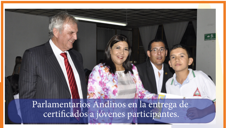
Parlamentarios Andinos en la entrega de certificados a jóvenes participantes.

Por estas y muchas otras razones, Ibagué se consolidó como un epicentro de convivencia, progreso y paz, mostrando que a pesar de haber sido golpeada históricamente por la violencia y el conflicto armado que azota a nuestra hermana República de Colombia, sigue convirtiéndose en un espacio para la promoción y protección de los derechos humanos y la paz.