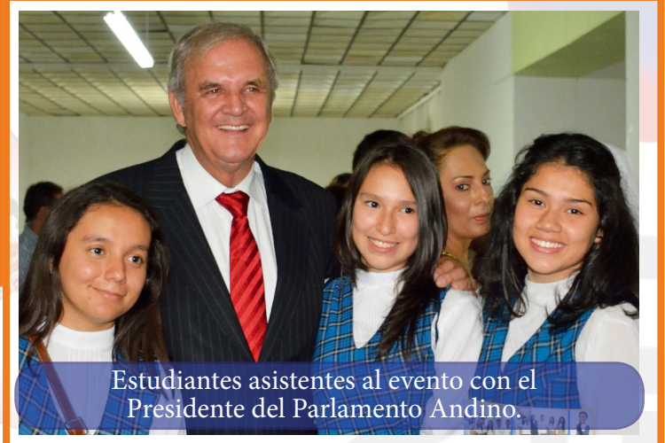
Estudiantes asistentes al evento con el Presidente del Parlamento Andino.

También quisiera hacer un reconocimiento especial a la ciudad de Ibagué por acogernos nuevamente y felicitarla tras 10 años de haber sido Declarada por el Parlamento Andino como la Capital Andina de los Derechos Humanos y la Paz, por su condición de centro de convivencia y desarrollo de los más altos valores éticos de los ciudadanos andinos, por ser un espacio propicio de encuentro para la paz y por el trabajo abnegado de sus pobladores en pro de la defensa de los derechos humanos.