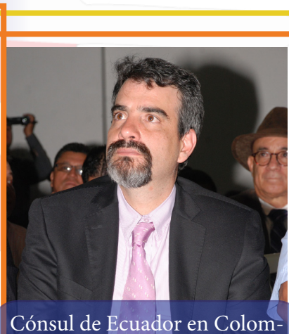
Cónsul de Ecuador en Colom- bia, Álvaro Garcés Egas.