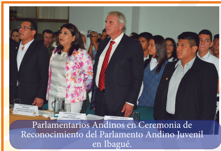
Parlamentarios Andinos en Ceremonia de Reconocimiento del Parlamento Andino Juvenil en Ibagué.

la República de Colombia Juan Manuel Santos en toda la nación, el Parlamento Andino se ha vinculado a la iniciativa de diversos sectores sociales y políticos por promover una cultura de paz en la ciudadanía. El Parlamento Andino Juvenil reivindica la designación de Ibagué como "Capital Andina de los Derechos Humanos", y es la primera de varias actividades conjuntas que se realizarán en la región para ayudar en la consolidación de una cultura de paz que genere las condiciones óptimas para el postconflicto.