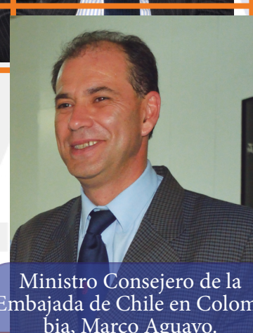
Ministro Consejero de la Embajada de Chile en Colom- bia, Marco Aguayo.